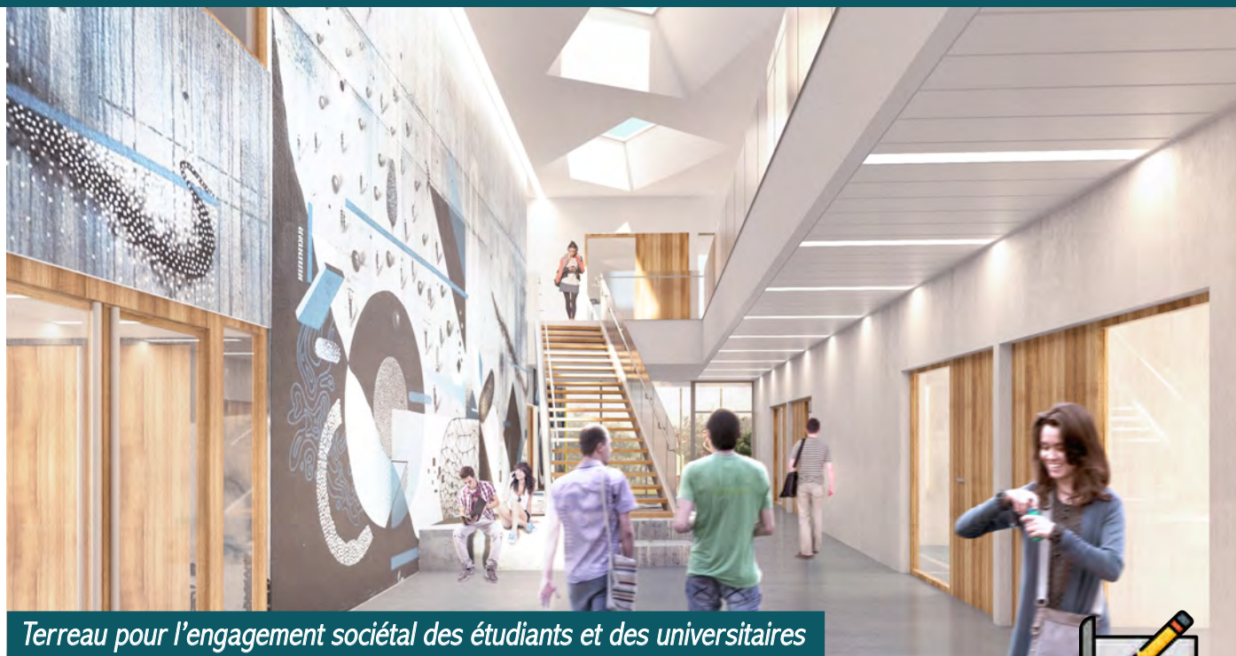
Terreau pour l'engagement sociétal des étudiants et des universitaires

Utilisateur : Université Toulouse III - Paul Sabatier