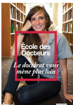
Un projet ambitieux de valorisation du doctorat auprès des secteurs socio-économiques et culturels