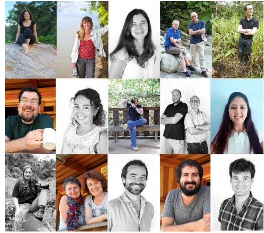
Une équipe interdisciplinaire