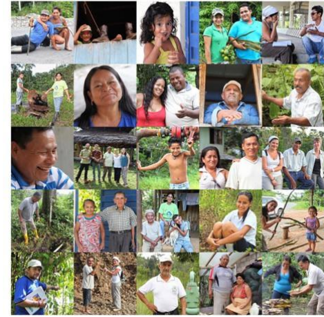
Des rencontres inoubliables

Une aventure humaine pour comprendre, évaluer et réduire les impacts pétroliers et les risques environnementaux, sanitaires et sociaux associés