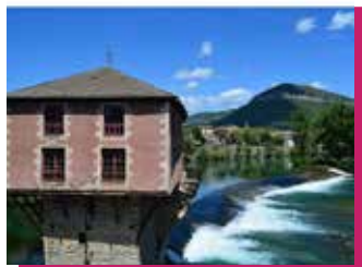
Moulin de Millau, Malacarne © DR

Inscription : serviceenseignementformations@millau.fr